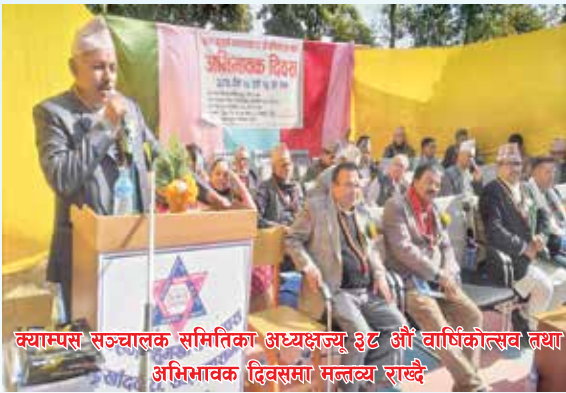
क्याम्पस सञ्चालक समितिका अध्यक्षज्यू ३८ औं वार्षिकोत्सव तथा अभिभावक दिवसमा मन्त्रव्य राख्दै