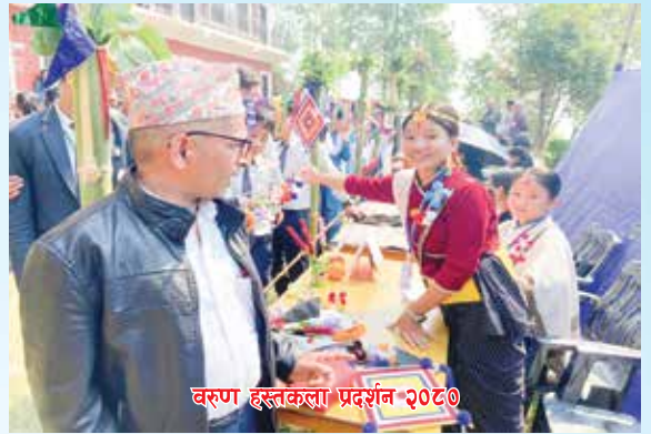
वरुण हस्तकला प्रदर्शन २०८०