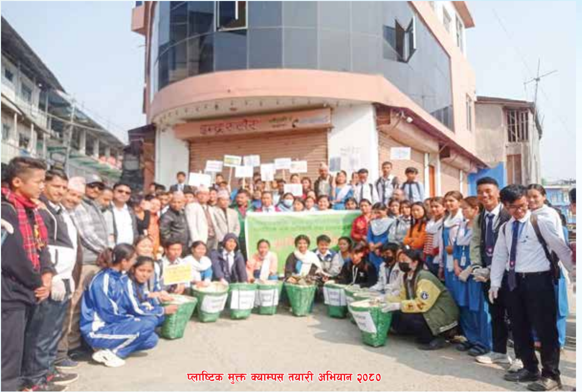
प्लाष्टिक मुक्त क्याम्पस तयारी अभियान २०८०