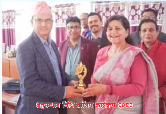
अनुसन्धान विधि तालिम कार्यक्रम २०८०