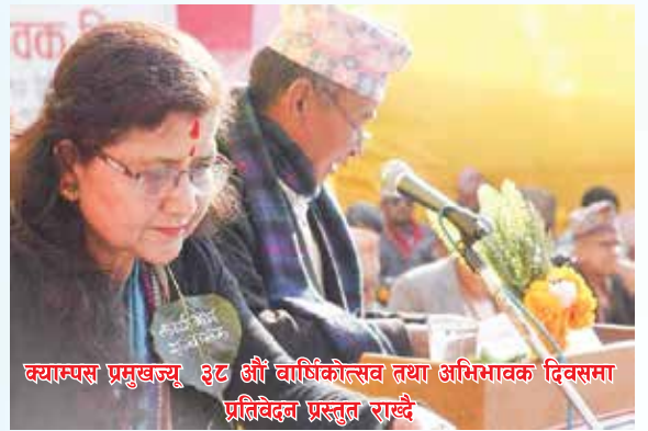
क्याम्पस प्रमुखज्यू ३८ औं वार्षिकोत्सव तथा अभिभावक दिवसमा प्रतिवेदन प्रस्तुत राख्दै