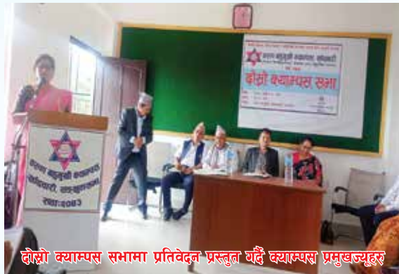
दोस्रो क्याम्पस सभामा प्रतिवेदन प्रस्तुत गर्दै क्याम्पस प्रमुखज्यूहरू