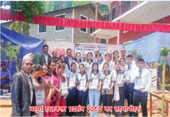
वरुण हस्तकला प्रदर्शन २०८० का सहभागीहरू