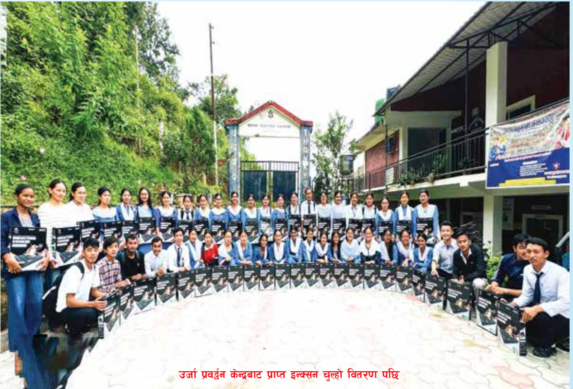
उर्जा प्रवर्द्धन केन्द्रबाट प्राप्त इन्क्सन चुल्हो वितरण पछि