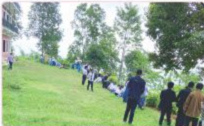
वातावरण तथा तरतई कार्यक्रम अन्तर्गत SAMको सञ्चालना सुत्रवारी सञ्चालन बन्दि विद्यालयद्वारा