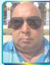
राजकुमार श्रेष्ठ सदस्य