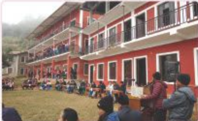
स्वम्भरको ३७ औं वार्षिक उत्सवमा आयोजना गरिएको नयाँकात इतिहासविद्यालय आँखारी विद्यालयद्वारा