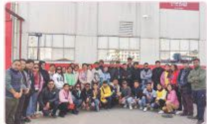
कोका कोना क्याम्पसको उत्साह बारे अन्तरकृपा हरनाथ ताम्जुङ्गक परिवारमा विद्यालय तथा आचार्यक