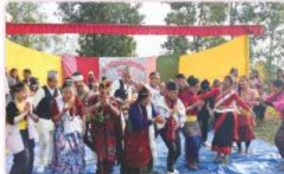
स्वम्भरको ३७ औं वार्षिक उत्सवमा कार्यक्रममा नयाँ इन्चुस बन्दि विद्यालयद्वारा