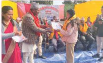
स्वम्भरको ३७ औं वार्षिक कार्यक्रममा मण्डलकोय नारा एवं स्वाम्भर इन्चुस कृष्ण राहुद अधिकारीद्वारा प्राकृषिक वितरण गर्नुदै