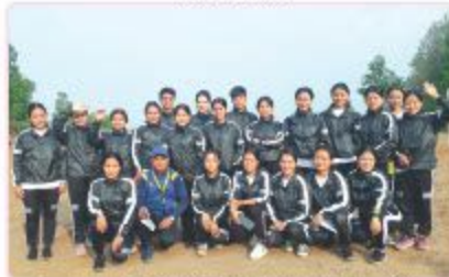
स्वाम्भर तथा आरिरोक सिला विषयका विद्यालयद्वारा अन्त्येष्ट गर्दि