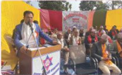
स्वम्भरको ३७ औं वार्षिक कार्यक्रममा आएको मन्त्रालय अन्तर्गत बन्दि खैदवारी नगरपालिका इन्चुस मीस वार्षिक