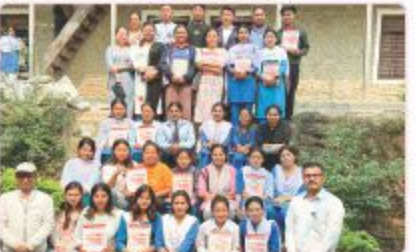
पि.इ.टी. कोषी वर्कमा विद्यालयद्वारा अन्त्येष्ट अभिमुखिकरण कार्यक्रम हरनाथ कार्यक्रम सञ्चालक र सिला अन्त्येष्ट अभिमुखिकरण कार्यक्रम